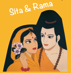
Sita & Rama

日印共作長編アニメーション映画。8億円の資金と9年の歳月をかけ、総勢450名のアニメーターが描き上げた100,000枚以上の手描きセル画により1992年12月に完成した。インドにおいて一部で放映が行われ、低画質のDVD等が販売されたが、本格的な配給公開は行われなかった。日本においては電通配給により渋谷シネマライズで夏休み期間に限定上映(「ムトゥー踊るマハラジャ」と併映)がなされたが、本格的な配給公開とはならず、「幻の映画」となった。2021年、作品の公開を望む多くの方の声や「時代の要請」を受けて、劇場用アニメーション映画《4Kデジタル・リマスター》として色鮮やかに甦った。